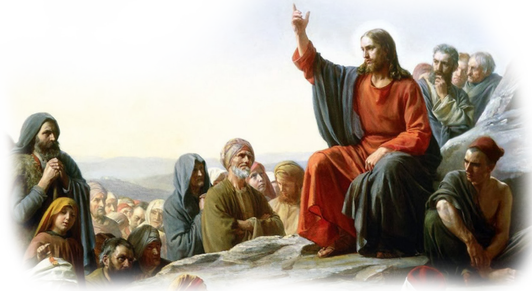
„Il Discorso della Montagna“ di Carl Heinrich Bloch

Auf dem Berg gibt Christus den Jüngern ein neues Gesetz, das im Herzen geschrieben ist, nicht mehr auf Stein, das unser Leben erneuert und gut macht, selbst wenn die Welt uns zu versagen scheint und voller Elend ist. Jesus verkündet die Gute Nachricht für die gesamte Menschheit.