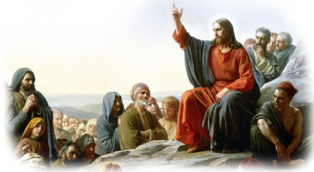
“Il Discorso della Montagna” di Carl Heinrich Bloch

Na gori Krist daje svojim učenicima novi zakon, zapisan u njihovim srcima, a ne više na kamenu, koji obnavlja naše živote i čini ih dobrima, čak i kada se čini da nas je svijet iznevjerio i pun je bijede. Isus naviješta Radosnu vijest cijelom čovječanstvu.